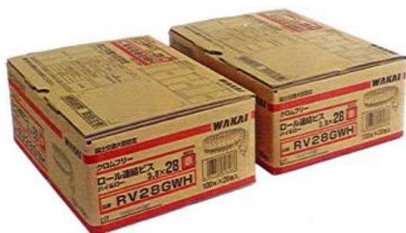
国土交通大臣認定